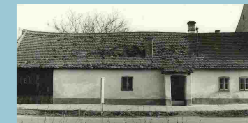
Památka lid. arch.: dům č. 46