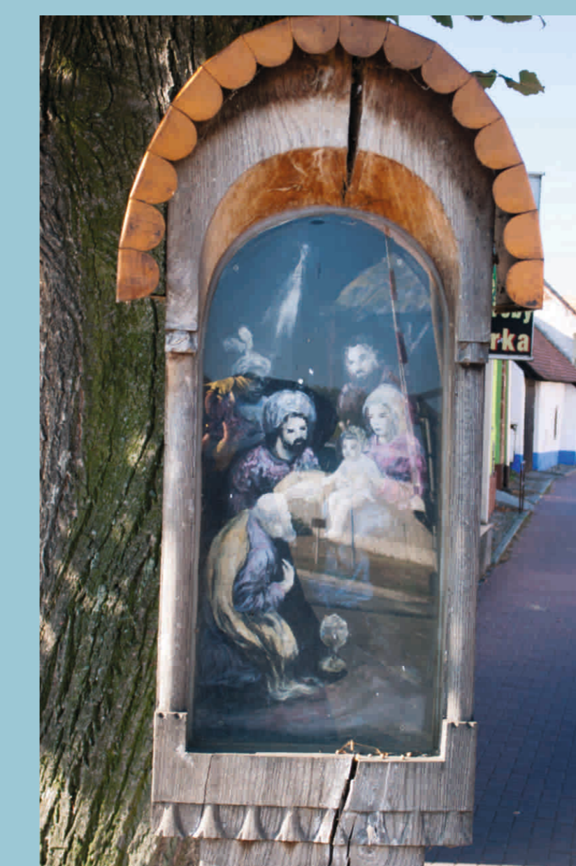
Poklona sv. Tří králů