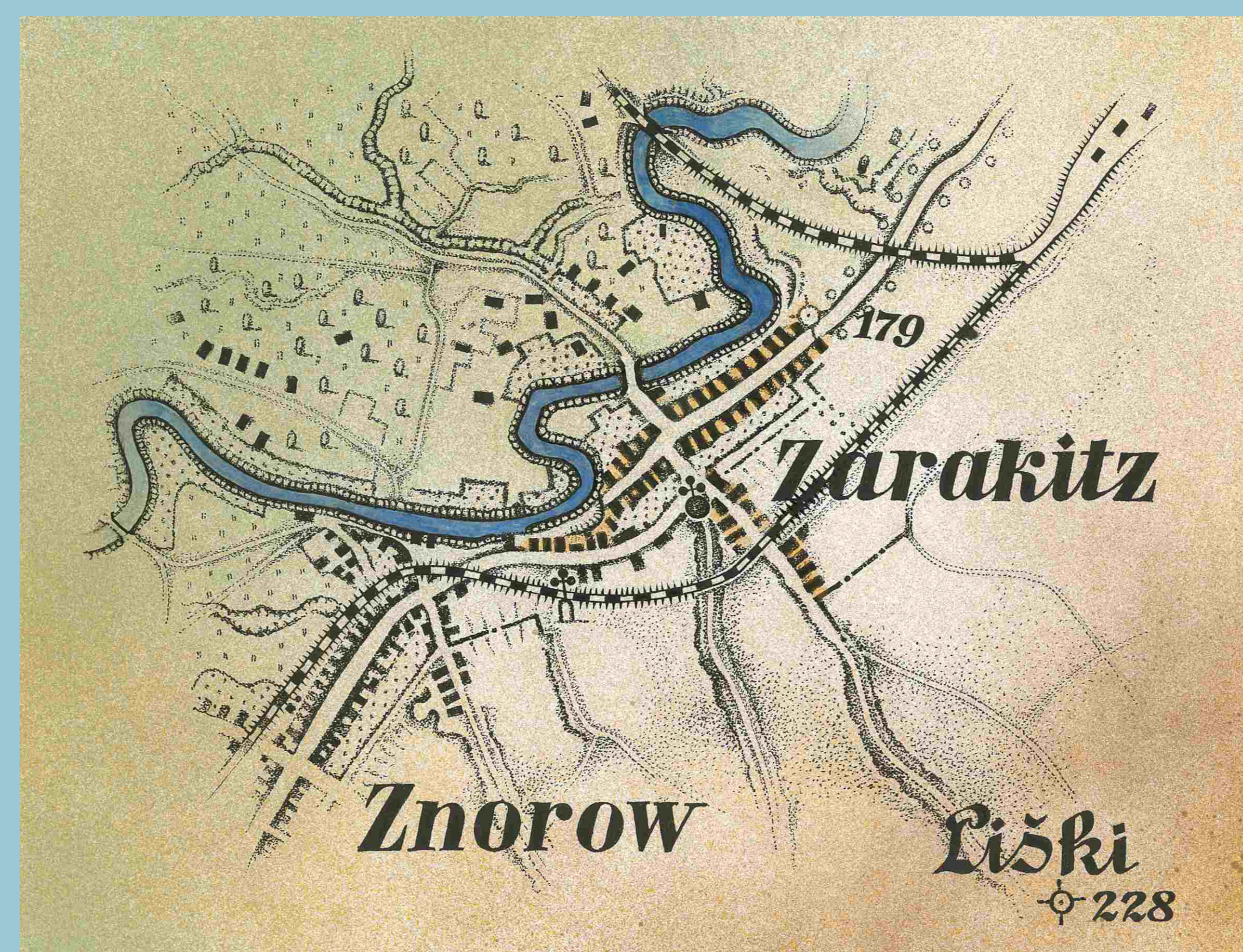
Zarazice podle mapy z r. 1890