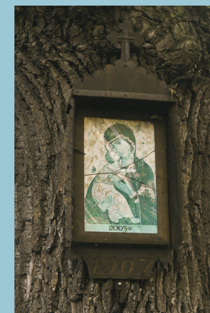
Obrázek v lese