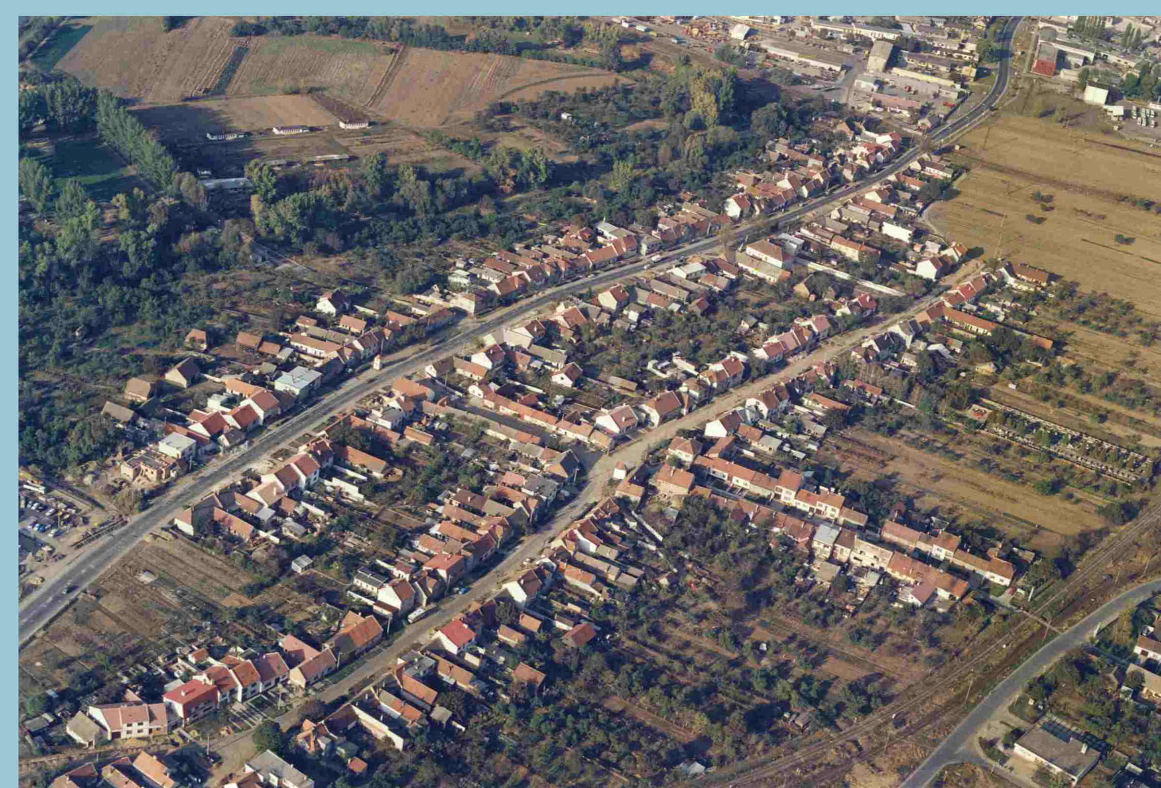
Letecký snímek z r. 1995